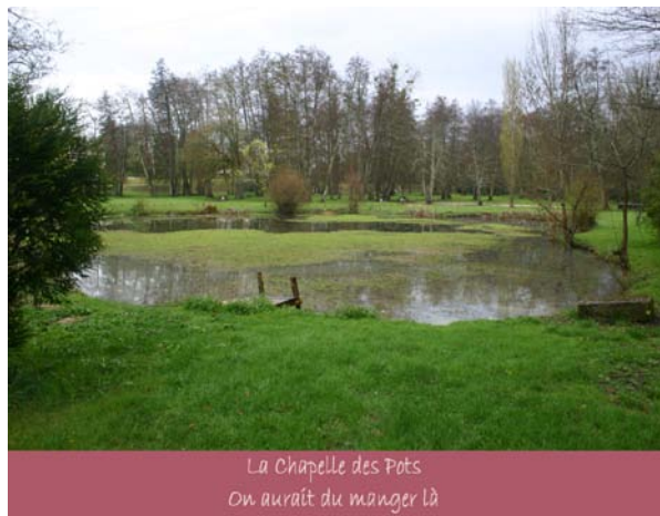
La Chapelle des Pots On aurait du manger là

Une petite balade dans Vénérand et l'heure du repas avait sonné. Après un vote unanime, la décision fut prise de nous restaurer dans le foyer rural de Saint Savinien et non au bord de l'eau à la Chapelle des Pots de peur que l'eau nous tombe dessus.