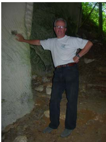
Monsieur le président sécurisant les lieux.

Mais il a fallut revenir à la civilisation.