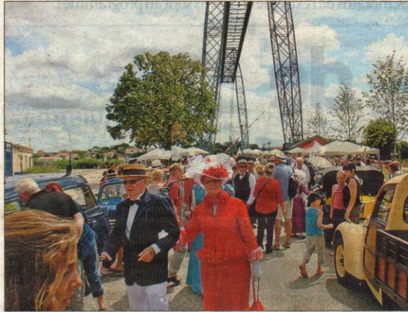
Des élégants sortis tout droit de l'année 1900.

TRANSBORDEUR Petit voyage dans le temps, de 1900 à 2012, pour fêter les 112 ans du pont